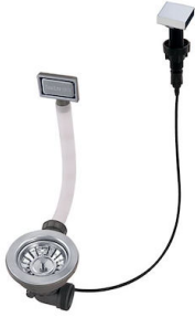
自动下水 - PM 8407 113